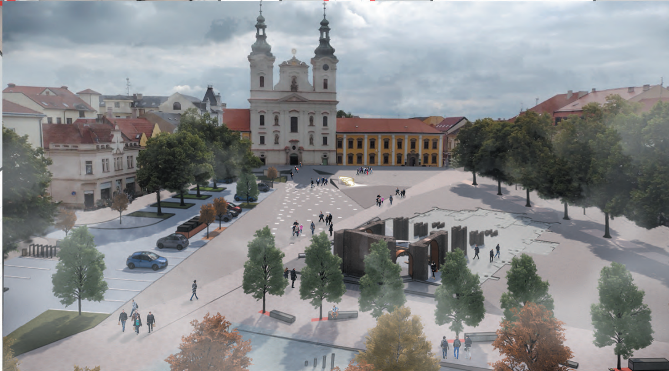
Náhľad smerom na kostol sv. Františka Xaverského