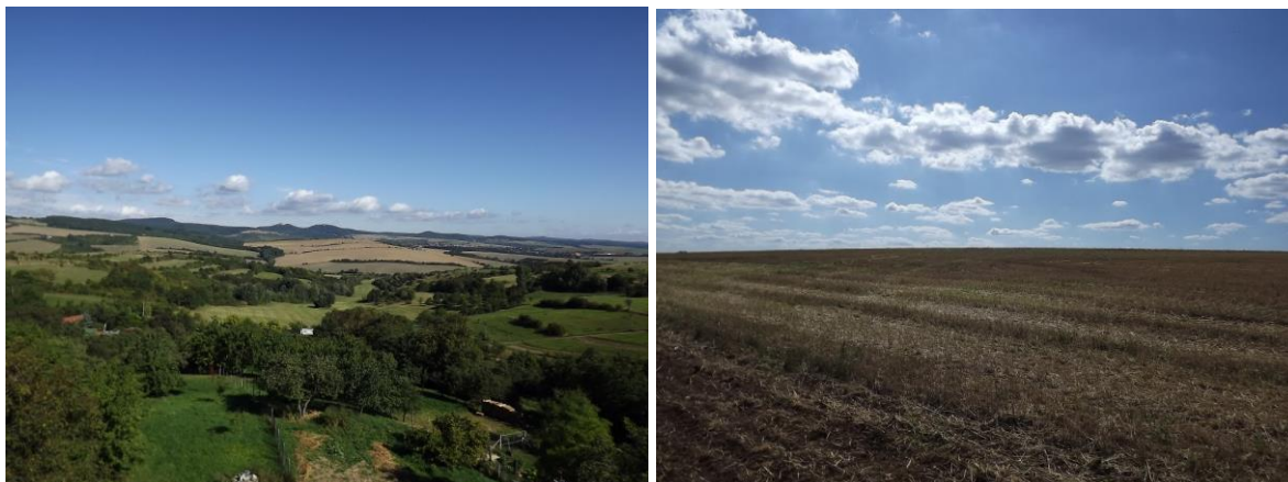
Dva základní typy krajiny – extenzivně využívané území na západě a velkovýrobně obhospodařovaná krajina východně.

V daném případě se jedná o území představující pahorkatinu klesající západně od obce do hlubokého údolí a následně stoupající na horizont, tvořenou svahem s agrárními terasami, členěnými vzrostlou zelení se zbytky původních ovocných sadů. Jedná se o přírodní společenstva, u kterých je žádoucí jejich zachování a omezení zásahu stavební povahy.