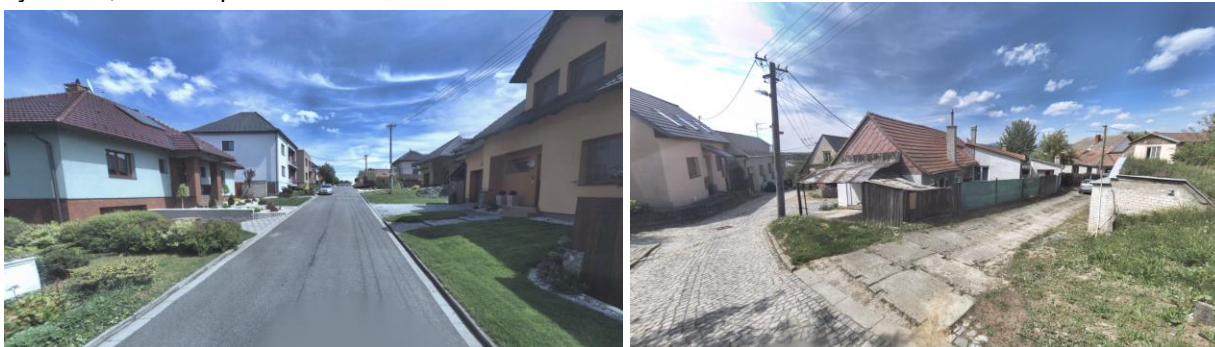
Novodobá zástavba; původní zástavba s nevyhovující sítí pozemních komunikací

Z historického vývoje je zřejmé, že se jednalo o zemědělsky orientované sídlo v krajině. První písemná zmínka o obci pochází z roku 1331. Počátky osídlení lze však dokladovat již v době kamenné. V území je vyšší podíl veřejných prostranství a ploch zeleně, zejména travnaté plochy a plochy zahrad ve vnitroblocích. V zastavěném území se nepředpokládá výrazný rozvoj zástavby; spíše jako náhrada za stávající. Zástavbu v sídle lze definovat jako sevřenou i volnou řadovou zástavbu podél komunikace, avšak částečně přestavěnou, části území s předzahrádkami. Část území se vyznačuje novodobou výstavbou, která odpovídá době vzniku.