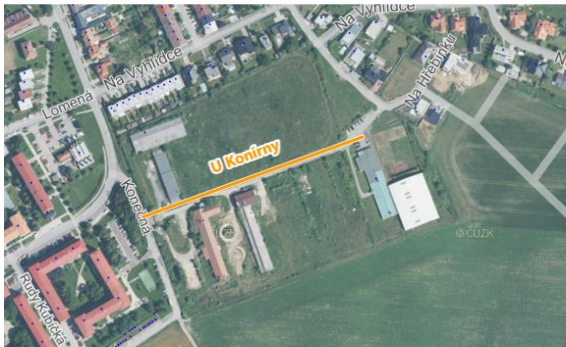
Mapa 4: Lokalita „Konírna“