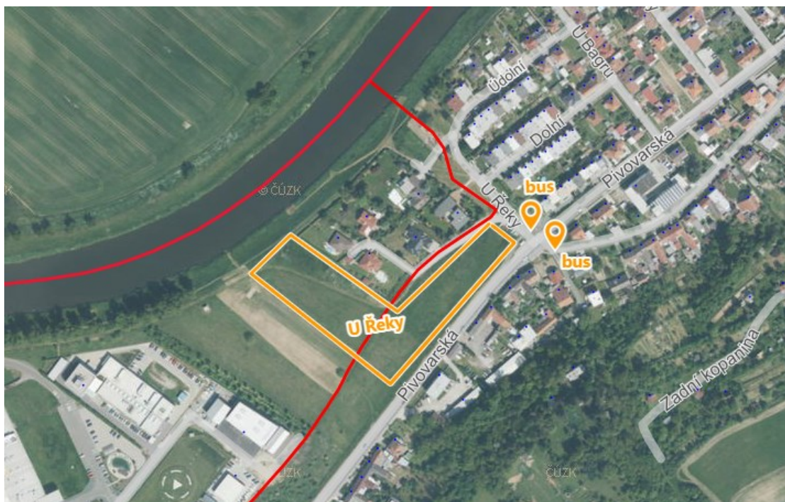
Mapa 3: Lokalita „U Řeky“

V Jarošově dochází k výstavbě nové lokality (viz žlutě). Dle diskuze vyplynulo pojmenovat celou lokalitu „U Řeky“, v návaznosti na současný název. Stejně tak přejmenovat autobusové zastávky u této lokality, které dnes nesou název „U Bagru“ (ulice U Bagru se nachází až dále směrem k centru Jarošova).