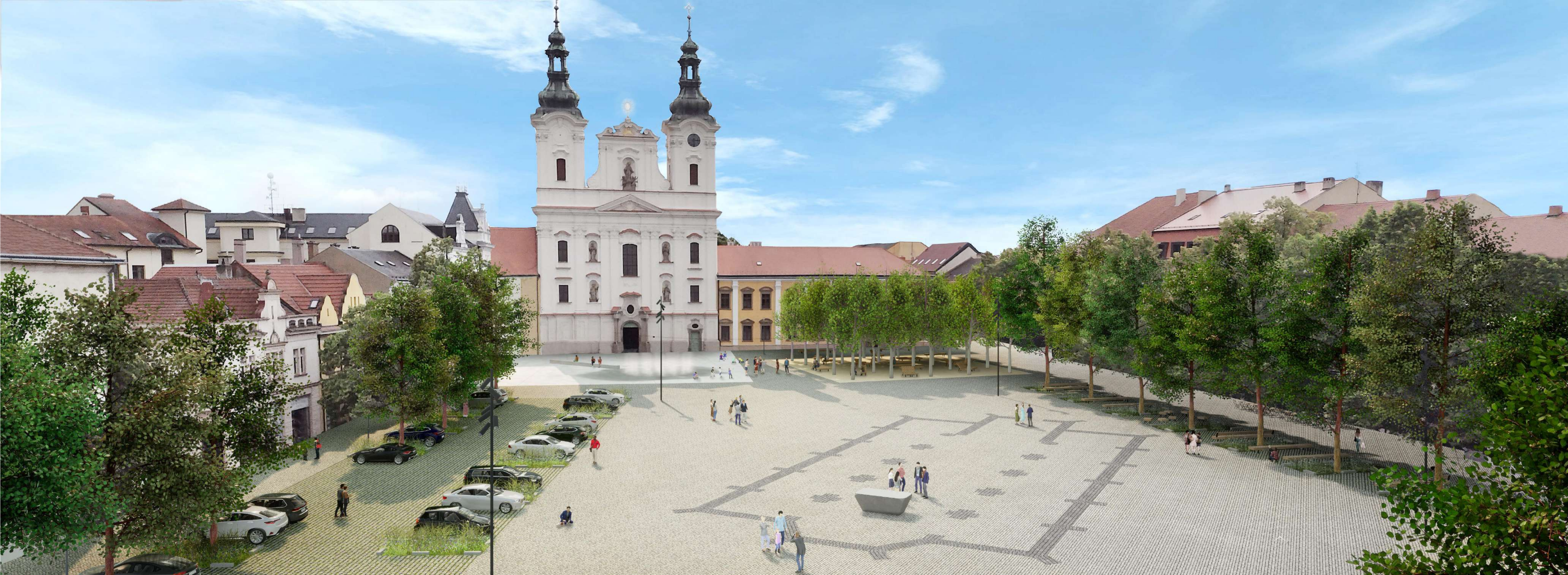
▼ Detail prostoru před kostelem a radnicí 1 : 250