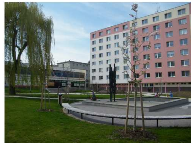
Sídliště náměstí Republiky

Lokalita sídliště Malinovského a náměstí Republiky vykazovala řadu nedostatků a stavebního opotřebení. Podobně jako při úpravě veřejného prostranství v Tůních, i zde spočíval hlavní cíl v rekonstrukci komunikací a chodníků, rozšíření parkovacích míst, dále v úpravách zeleně a doplnění městského mobiliáře. Projekt se členil na 3 lokality, a sice Lokalitu 1 – náměstí Republiky, Lokalitu 2 – vnitroblok za hotelem Morava a Lokalitu 3 – ulice Mánesova a Boženy Němcové. Po rekonstrukci byl celý tento rozsáhlý prostor proměněn v nové moderní sídliště, jehož nová podoba jistě výrazně přispěje ke zkvalitnění života občanů v těchto lokalitách. Celková revitalizovaná plocha byla v tomto případě 10.517 m 2 a dodavatelem stavebních prací se stalo Sdružení pro obytný soubor Malinovského a náměstí Republiky složené z účastníků Pražské silniční a vodohospodářské stavby, a.s., SVS-CORRECT, spol. s r.o. a TUFÍR spol. s r.o. Podobně jako sídliště Tůně, i tato akce byla realizována v rámci Integrovaného plánu rozvoje města.