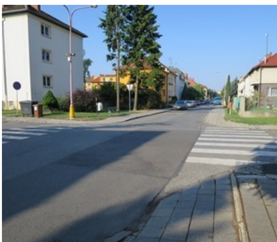
Foto po realizaci