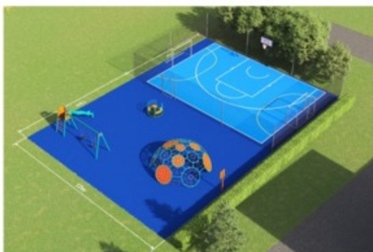
Vizualizace DH Na Hraničkách:

Hřiště v ulici Na Hraničkách bude určeno k uspokojení potřeb dětí různých věkových kategorií. Bude rozděleno na dvě zóny: větší děti se mohou těšit na sportovní hřiště s brankami na minikopanou a s basketbalovým košem, které bude ohrazené ochrannou sítí, malí návštěvníci si zase budou moci užívat dětské hřiště s novou houpačkou, skluzavkou, kolotočem a velkou lanovou kopulí. "V této části Mařatic dlouhodobě chybí kvalitní místo pro dětské hry a navíc zde v posledních letech proběhla nová výstavba, proto jsem rád, že jsme se s místní komisí dohodli na vzniku moderního dětského hřiště místo stávající nevyhovující asfaltové plochy," konstatoval místostarosta města Čestmír Bouda.